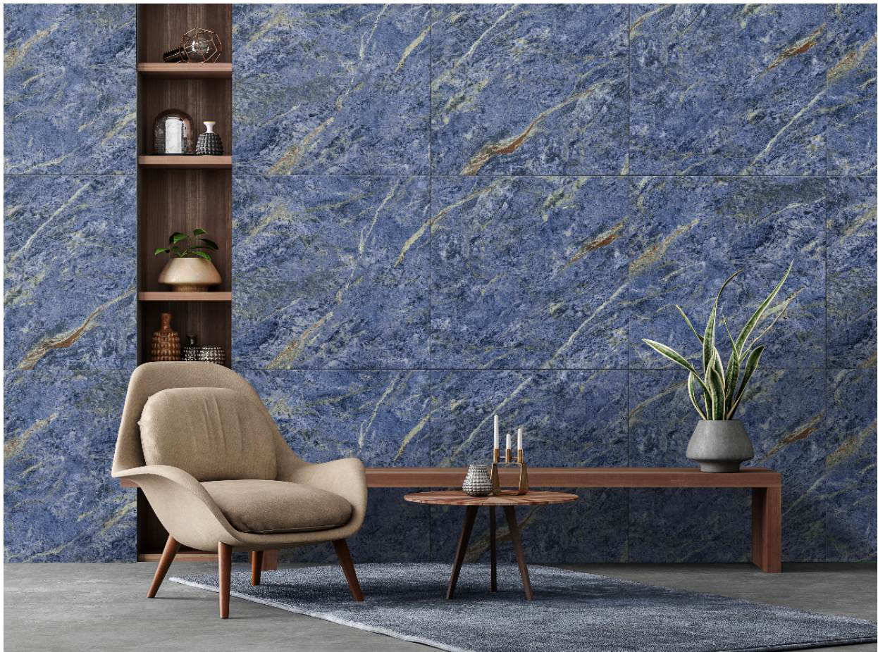
Ambiente do revestimento Azul Bahia (PSI-63810) da Incenor