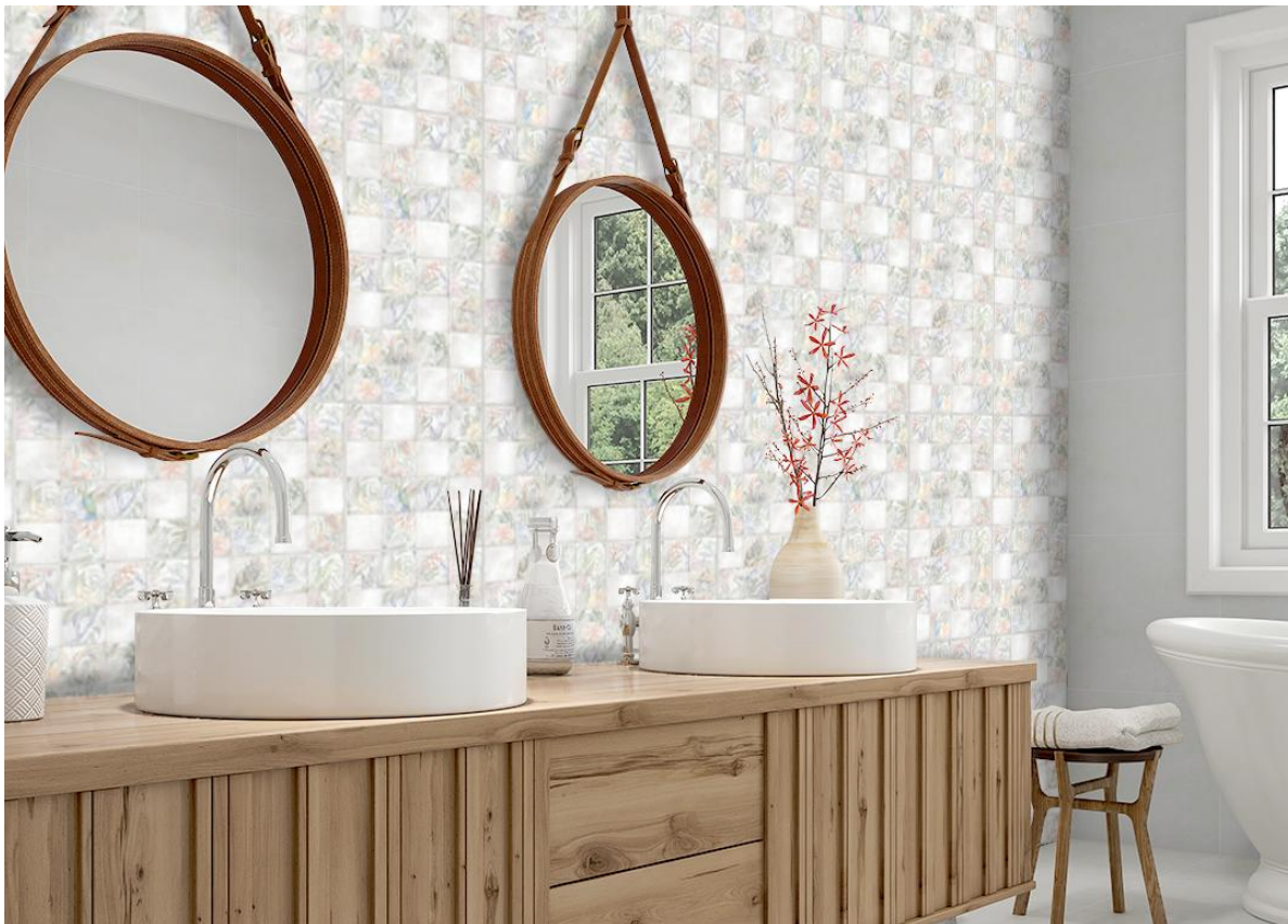
Ambiente do revestimento Viva Brasil (PSI-63830R) da Incenor