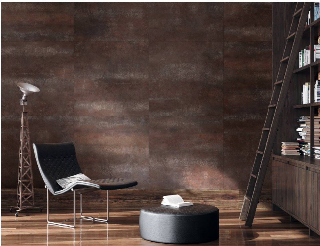
Ambiente do porcelanato Aço Corten (PTG76350R) da Tecnogres